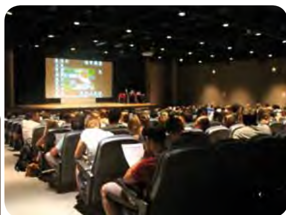
RENTRÉE DE LOS ESTUDIANTES INTERNACIONALES 2011