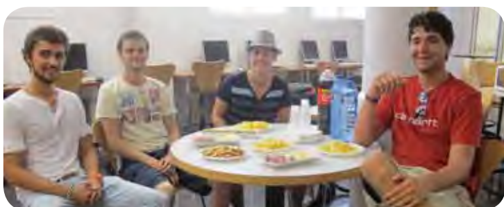
RENTRÉE DE LOS ESTUDIANTES DE 3º DE BACHELOR