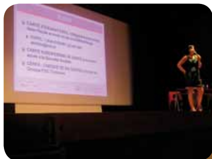
RENTRÉE DE LOS ESTUDIANTES DE MÁSTER 2 EN EL INSTITUT FRANÇAIS