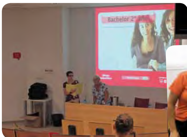
RENTRÉE DE LOS ESTUDIANTES DE 2º DE BACHELOR